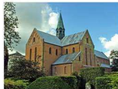
Sorø Klosterkirke Sorø Klosterkirke