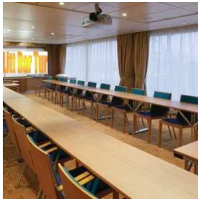
Litt rare foredrag

Avreise fra Oslo kl. 14.00 med Color Line til Kiel. Ombord vil den litt rare reiseleder holde tre foredragsbolker med innlagte kaffe/fruktpauser. Tema gir seg selv: tysk litteratur, historie og kultur , med både noe gammelt og noe moderne. Da man ikke lever av åndelig føde alene blir det selvsagt middag og det hele er pakket inn i cruisefølelsen.