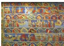
Tristan og Isolde teppe