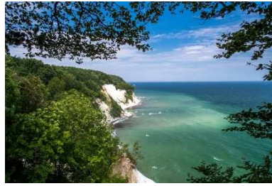
National Park Jasmund