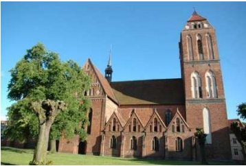
Domkirken i Güstrow

Sist på ettermiddagen kommer vi til UNESCO-verdensarv-byen Stralsund . Vi får en liten byrundtur med norsktalende guide før vi sjekker inn og får middag på vårt hotell, Baltic Stralsund . Her blir vi to netter