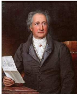
Johann Wolfgang von Goethe