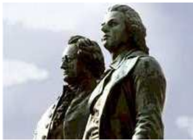
Goethe & Schiller