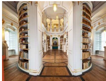
Hertuginne Anna Amalias Bibliothek