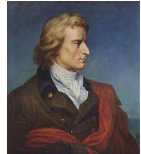
Johann Christoph Friedrich von Schiller