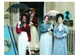
Jane Austen's Bath