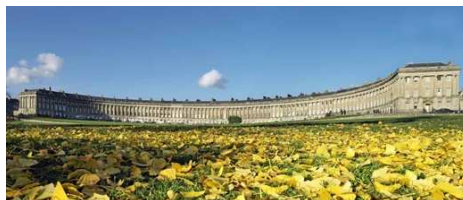
The Royal Crescent, Bath