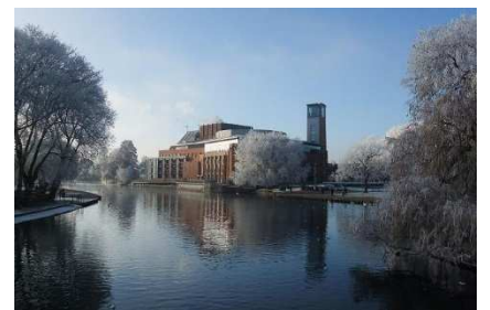
Royal Shakespeare Theatre