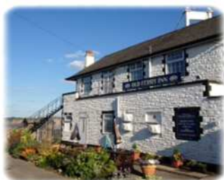
The Old Ferry Inn

Vi sjekker inn og overnatter de neste 2 netter på The Dragon Hotel , sentralt i Swansea. Men dagen er ikke slutt med det, for man kan ikke besøke Dylan Thomas by uten å gå på pub! Så i forbindelse med middag på restaurant i Swansea, vil vi også få en Literary Pub Crawl , inkl. et par drinker underveis.