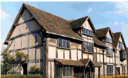
William Shakespeares fødested

Etter en liten rast på hotellet møtes vi kl.17 til middag, sammen med en historisk og litterær innføring i kveldens Shakespeare-drama, som vil bli spillet av verdensberømte Royal Shakespeare Company . (Hvilket stykke vil bli klart våren 2014).