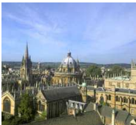
The City of dreaming spires (Matthew Arnold)

Vi blir innkvartert på Best Western Linton Lodge hotel , der vi også får middag.