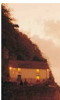
The Boat House