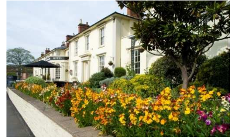
Hotel Grosvenor, Stratford-upon-Avon