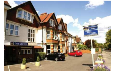
Linton Lodge Hotel