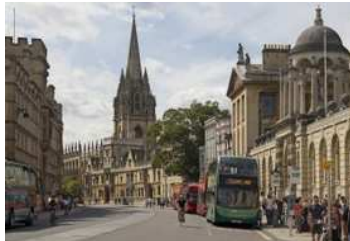
Oxford High Street