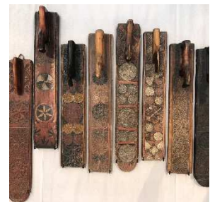
Fra Mjøsa Ark