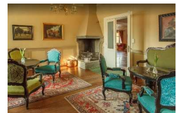
Breiseth Hotell interiør