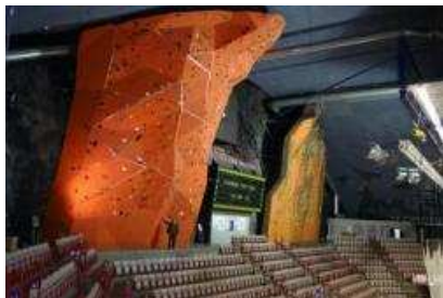
Gjøvik Olympiske Fjellhall

På den siste strekk inn mot Oslo blir den en liten time til å fordøye inntrykkene. Planlagt ankomst til Oslo er ved 18-tiden.