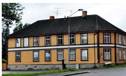
Rolf Jacobsens Skappels gate 2