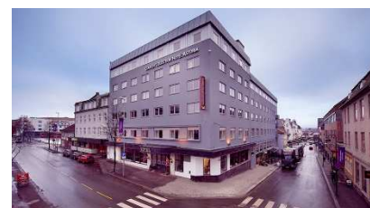
Clarion Hotel Astoria