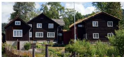
Sigrid Undsets Bjerkebæk