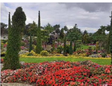
Flor og Fjære

Lunsjen på Flor og Fjære er normalt så fyldig at vi velger å ikke ha innlagt felles middag på kvelden. Det vil derfor være tid på egen hånd i Stavanger sentrum med gamlebyen og her er det mange muligheter til å finne seg en liten kveldsmat om det skulle være nødvendig.