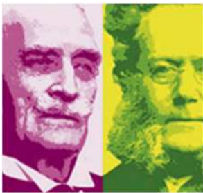
Hamsun og Ibsen

På den siste strekk inn mot Oslo etter lunsj blir det litt tid til å fordøye inntrykkene fra disse dagene. Planlagt ankomst til Oslo er ved 18-tiden.