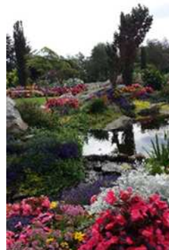
Flor og Fjære