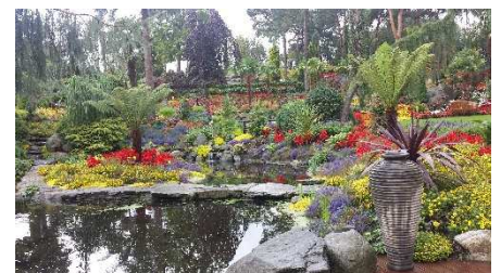
Flor og Fjære