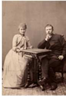
Hulda og Arne Garborg