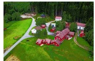
Heddan Gard Gjestegard