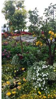
Flor og Fjære