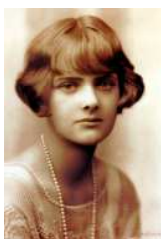
Daphne Du Maurier