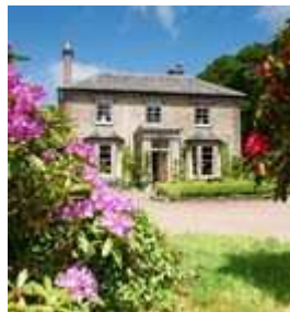
Horn of Plenty