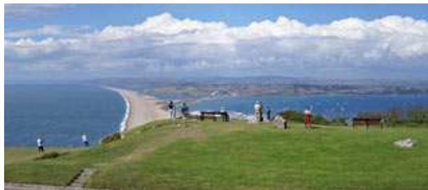
Utsikt over Chesil Beach