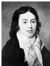
Samuel T. Coleridge