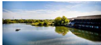
Reading Lake Hotel