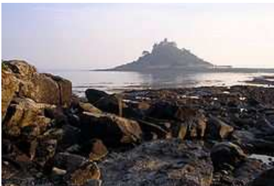
St. Michael's on the Mount.

Middag på Oliver's Eatery en kort spasertur fra hotellet – og det vil være noe tid til rådighet før middag.