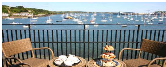
Utsikten fra Greenbank Hotel